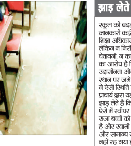
वलासरूप में एकत्र कचरा

आए इसके लिए स्वामी आत्मानंद स्कूल का संचालन किया जा रहा है। विकासखंड प्रतापपुर के डांडकरवां में शासन की उत्कृष्ट विद्यालय स्वामी आत्मानंद इंग्लिश मीडियम स्कूल संचालित है लेकिन स्कूल प्रबंधन की लापरवाही तथा देख रेख के अभाव में स्कूल परिसर कूड़ा करकट में तब्दाल हो गया है। यहां