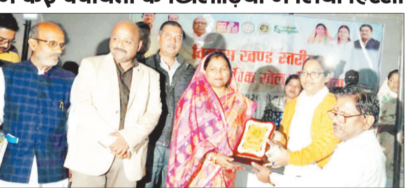
खिलाड़ियों को सम्मानित करते अतिथि